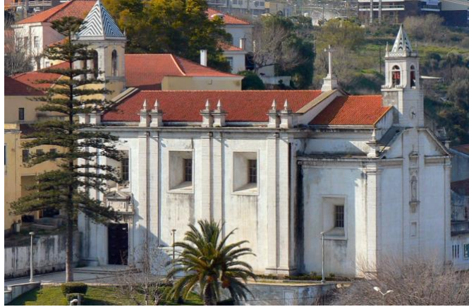
a Igreja Matriz de Nossa Senhora da Purificação de Sacavém na actualidade