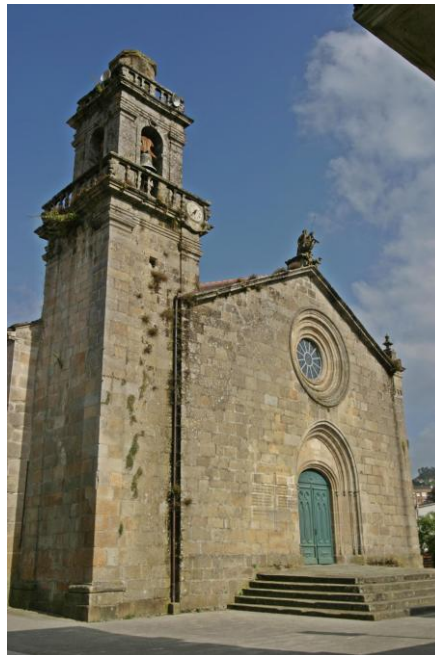
A Igreja de Santiago de Vilavella de Redondela